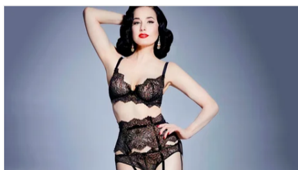
Как менялась мода на нижнее белье с 1900-х по наши дни