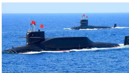
Секретное оружие Китая: самое мощное в мире!