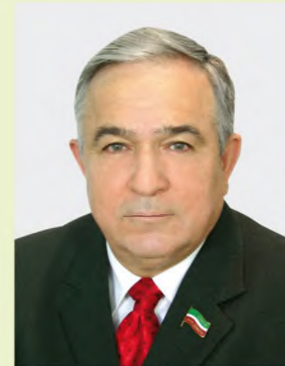
МИРГАЛИМОВ Хафиз Гаязович

1957 елда туган. Яшәу урыны – Татарстан Республикасы, Казан шәһәре. Эш урыны (шөгыленен төре) – Татарстан Республикасы Президенты вәкаләтларен вакытлыча башкаручы. «БЕРДӨМ РОССИЯ» партиясе Татарстан региональ бүлеге сайлау берләшмәсе тарафыннан чыгарылды. «БЕРДӨМ РОССИЯ» партиясе әгъзасы. «БЕРДӨМ РОССИЯ» партиясенен Югары советы әгъзасы.