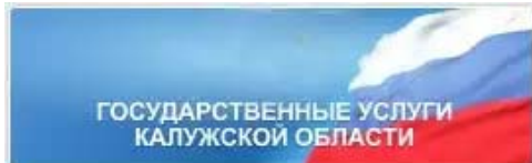
ГОСУДАРСТВЕННЫЕ УСЛУГИ КАЛУЖСКОЙ ОБЛАСТИ